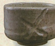
影斑唐津茶鉢 14代中里太郎右衛門 2019年

(表面の作品は右上より) 色絵吹墨墨はじき雪文翡翠香炉 14代今泉今右衛門 2019年 / 濁手藤文花瓶 15代酒井田柿右衛門 2023年 / 唐津三彩小壺(奈良三彩小壺復元作品) 14代中里太郎右衛門 2017年 / 国宝 三角緑三神三獸鏡 伝沖ノ島出土4世紀