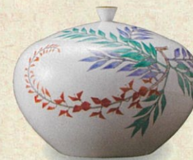
濁手藤文水指 15代酒井田柿右衛門 2020年